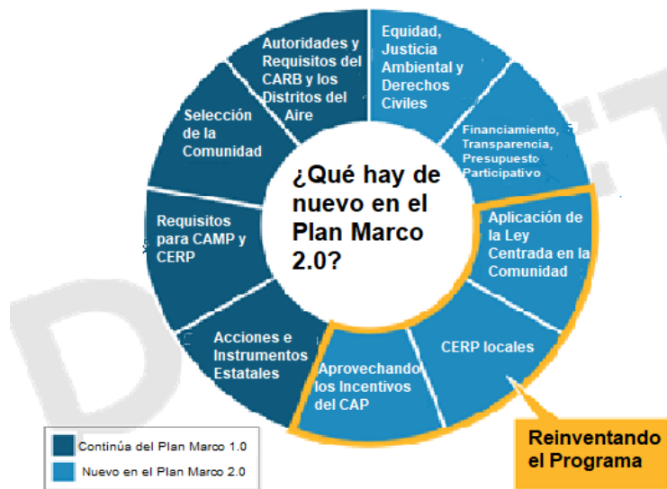
Imagen 2: ¿Qué hay de nuevo en el Plan Marco 2.0?