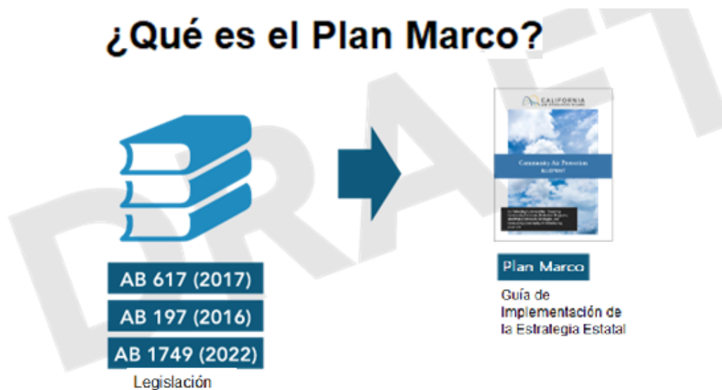
Imagen 1: El Plan Marco proporciona guía en las interpretaciones de CARB a la legislación fundamental.

Un requisito de AB 617 es que CARB considere seleccionar anualmente comunidades para el desarrollo de un Plan de Monitoreo del Aire Comunitario (CAMP, por sus siglas en inglés) y/o un Programa Comunitario de Reducción de Emisiones (CERP, por sus siglas en inglés). Con 19 comunidades seleccionadas a la fecha, existe mucho por aprender y emplear de maneras que beneficiarían a más comunidades, con especial atención en las 65 comunidades que han sido nominadas constantemente, pero no seleccionadas. Las 19 comunidades seleccionadas han recibido una gran parte de los recursos del Programa para implementar las redes de monitoreo de la calidad del aire específica de la comunidad, para desarrollar programas de reducción de emisiones, para mejorar el acceso de la comunidad a la información sobre la calidad del aire y las emisiones y para implementar medidas de incentivos. Desde el inicio, la selección formal de las comunidades tenía la intención de dar lugar a enseñanzas para ser empleadas más ampliamente. El conjunto diverso de comunidades seleccionadas y de subvenciones del aire financiadas han identificado diferentes soluciones que pueden ser modeladas y ampliadas cuando hayan sido eficaces en las comunidades afectadas de todo el estado. Una enseñanza clave es que la asociación y colaboración entre la comunidad, el gobierno y la industria afectada es la base si queremos cumplir la meta de AB 617.