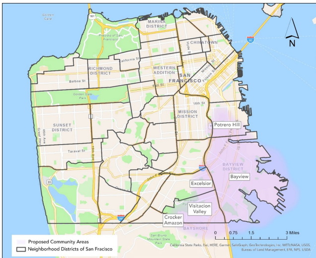
Barrios de San Francisco dentro de la zona comunitaria propuesta (morado)