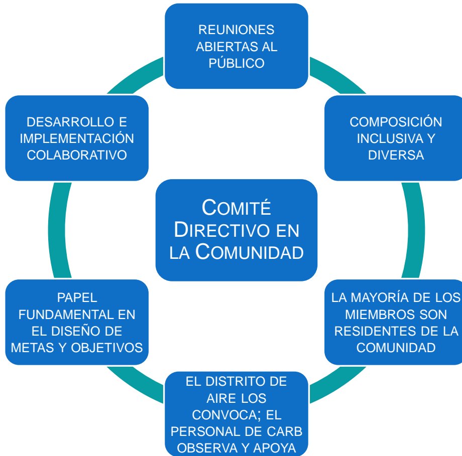
Figura C-3 Comité Directivo en la Comunidad

comunidad. La Figura C-3 destaca algunos componentes clave de un comité directivo en la comunidad.