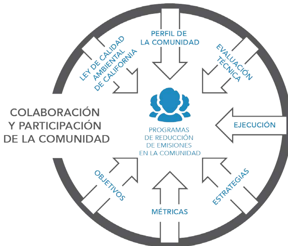
Figura C-2 Elementos que Requiere un Programa de Reducción de Emisiones en la Comunidad

Los requisitos incluidos en este apéndice se aplican al distrito de aire que deba preparar un programa de reducción de emisiones en la comunidad. CARB ha