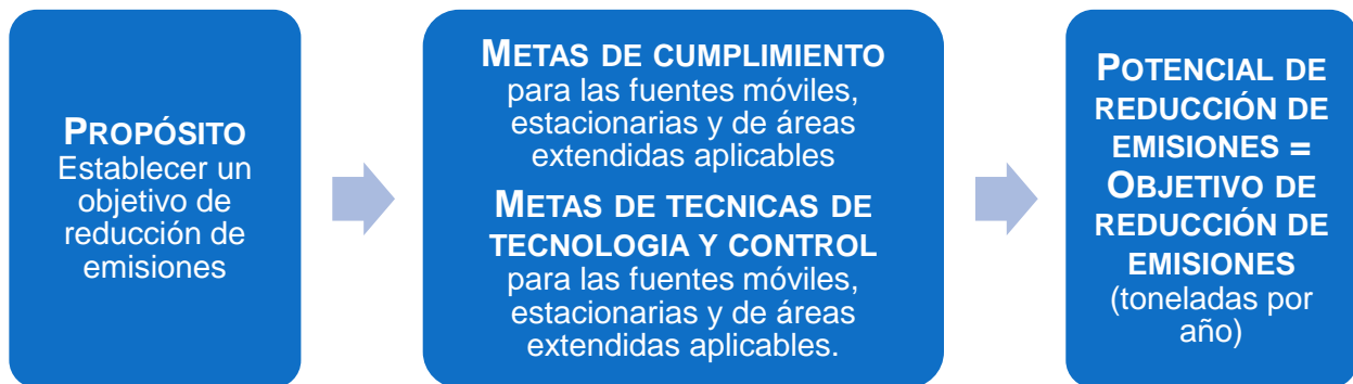
Figura C-4 Proceso para Establecer un Objetivo de Reducción de Emisiones

El propósito de las metas de cumplimiento, despliegue de tecnología e técnicas de control tiene dos partes: primero, determinar la magnitud de los objetivos de reducción de emisiones; y, segundo, proporcionar medidas numéricas y visibles que los miembros de la comunidad y otras partes interesadas puedan evaluar a medida que se implemente el programa de reducción de emisiones en la comunidad.