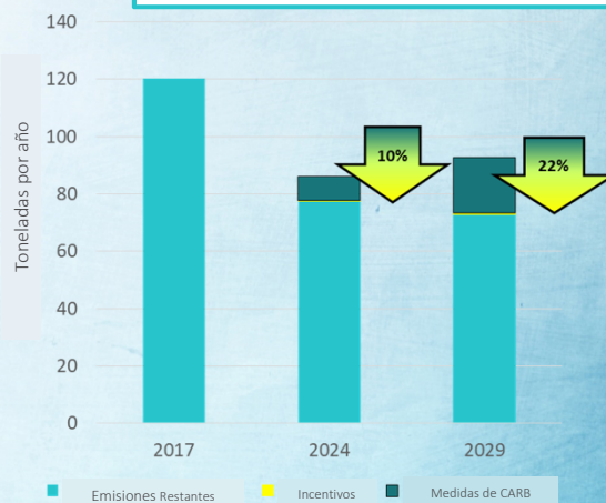
Reducciones de partículas de diésel (DPM) del CERP en los años 2024 y 2029: