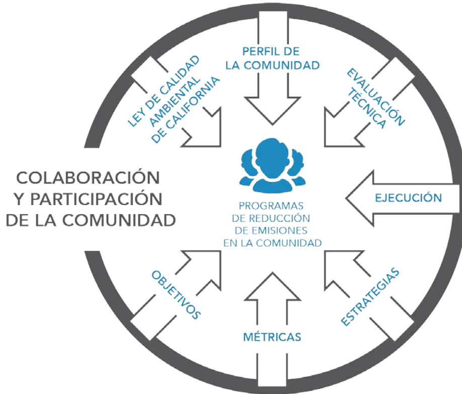
Figura C-2 Elementos que Requiere un Programa de Reducción de Emisiones en la Comunidad

Los requisitos incluidos en este apéndice se aplican al distrito de aire que deba preparar un programa de reducción de emisiones en la comunidad. CARB ha desarrollado criterios para cada elemento para asegurar una calidad y una exigencia uniformes en todas las comunidades y para dejar en claro qué es lo que CARB evaluará al considerar la aprobación de un programa de reducción de emisiones en la comunidad. Los distritos de aire deberán brindar suficiente información en la presentación y los informes anuales del programa de reducción de emisiones en la comunidad, para que CARB evalúe si cumplen con los requisitos mínimos.