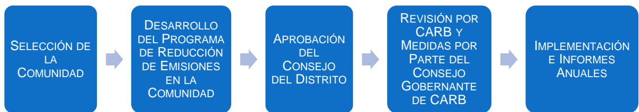
Figura C-1 Resumen del Proceso de los Programas de Reducción de Emisiones en la Comunidad

El propósito de los programas de reducción de emisiones en la comunidad es centrarse y acelerar nuevas medidas para lograr reducciones de la contaminación del aire directas